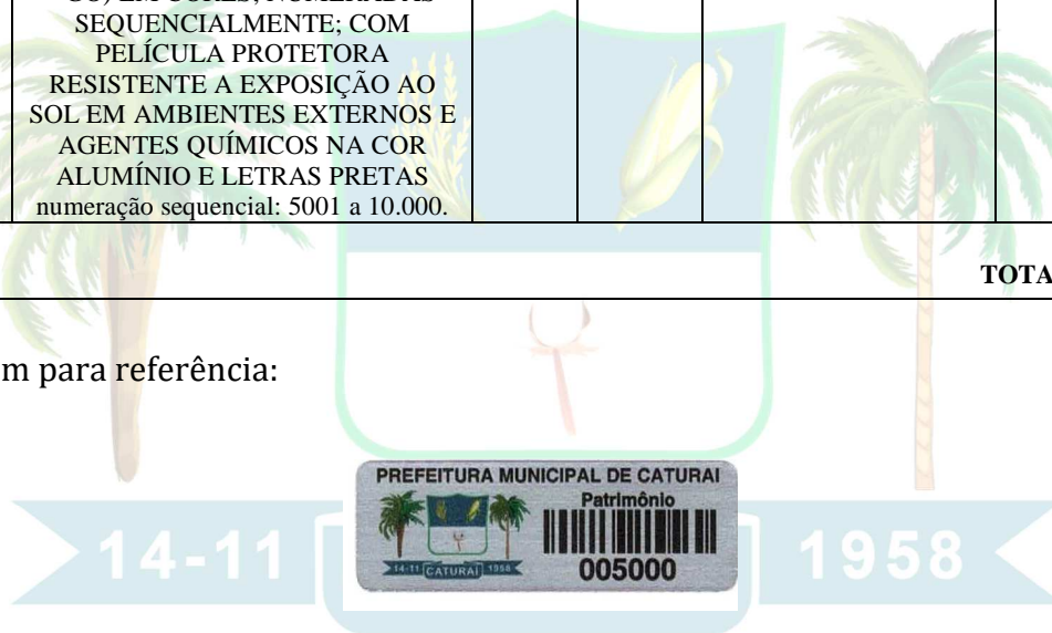
Imagem para referência:

3.1. O critério de julgamento adotado será o menor preço , observadas as exigências contidas neste Aviso de Contratação Direta e seus Anexos quanto às especificações do objeto.